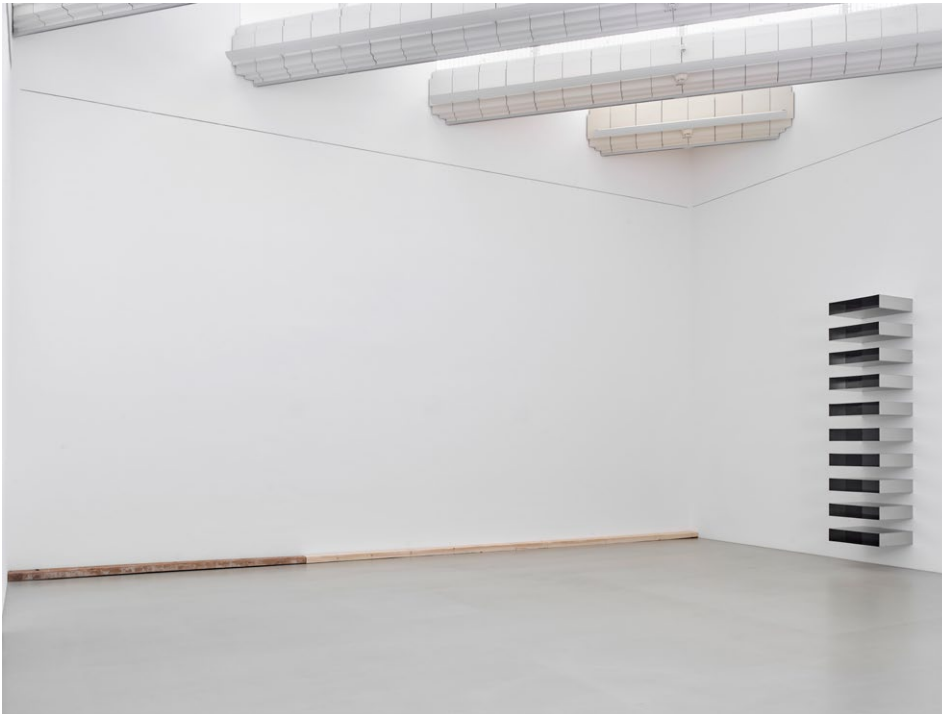
Donald Judd, Ohne Titel, 1974; Ulrich Rückriem, Holz, ergänzt, 1971/73, Ausstellungsansicht Von da an im Museum Abteiberg, 2017

Das Museum Abteiberg freut sich sehr, zwei Werke aus seiner Sammlung an das Marta Herford für die kommende Ausstellung Mindset Los Angeles: Frank Gehry, the Cool School and its Echoes (27. Juni 2026 – 10. Januar 2027) leihen zu können. Zum einen wird Richard Serras Neonarbeit Outside (1969) Teil der Ausstellung sein, eines von lediglich zwei Werken des Künstlers, die ausschließlich aus Neonröhren gefertigt sind und die dank dieser Materialität einen besonderen Stellenwert in seinem Schaffen einnehmen. Zum anderen wird ein Objekt der Minimal Art von Donald Judd gezeigt, das zu seinen berühmten „Stacks“ gehört. Ohne Titel (1974) besteht aus zehn gleich großen Edelstahlkästen mit rotvioletter Plexiglas, die in gleichmäßigem Abstand vertikal gestapelt an der Wand angebracht sind und Judds Interesse widerspiegeln, Kunst in Architektur zu integrieren.