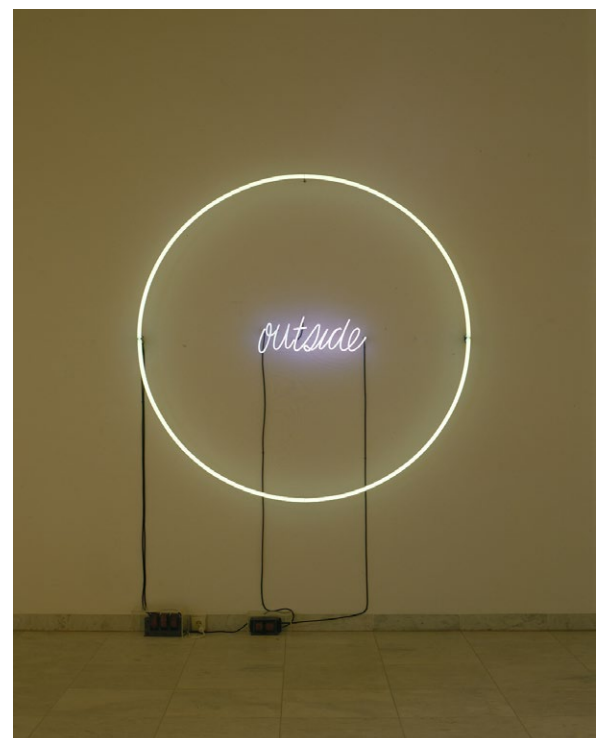
Richard Serra, Outside, 1969