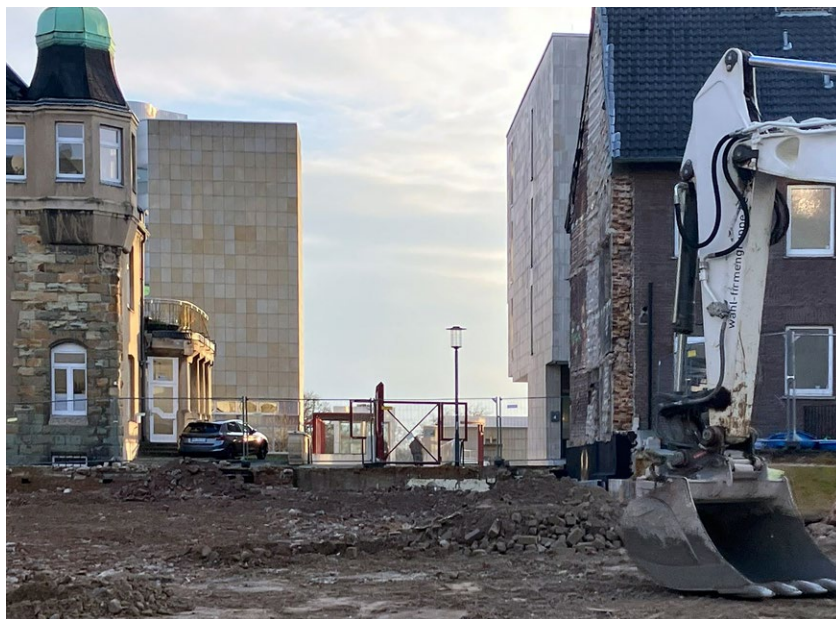
Durchstich, 2025.

Präsentation des neuen Buchs von Eva Branscome zur Geschichte des Museums Abteiberg in Kooperation mit der Baukunstklasse der Kunstakademie Düsseldorf. Symposium und Führungen im Vortragssaal, in den Museumsräumen und um das Museum herum