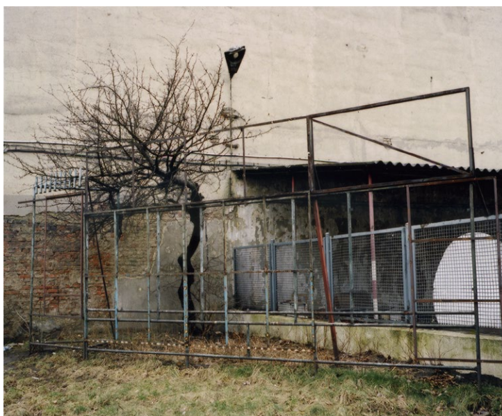
Peter Piller, Lódz 1–3 , 2008, C-Print, 30 x 40 cm (Motiv), 42 x 49 cm (Passepartout) 3 Motive, je 3 Exemplare, datiert, nummeriert, signiert. Preis je 900 €.

Peter Piller hat für Lódz 1-3 eine sehr kleine Auflage ausgewählt, die 2008 exklusiv für die Mitglieder des Museumsvereins herausgegeben wurde. Die Fotografien entstanden anlässlich der Ausstellungskoooperation des Museums Abteiberg mit dem Muzeum Sztuki in Lódz und dem Instytut Awangardy in Warschau; als Aufnahmen von alltäglichen Situationen, in denen die heutige Gegenwart als eine gebrochene Moderne erscheint. Das Projekt Porzadki Urojone. So ist es und anders war von diesem Gedanken bestimmt, sodass die drei Motive von Peter Piller das zentrale Moment dieser Ausstellung darstellen.