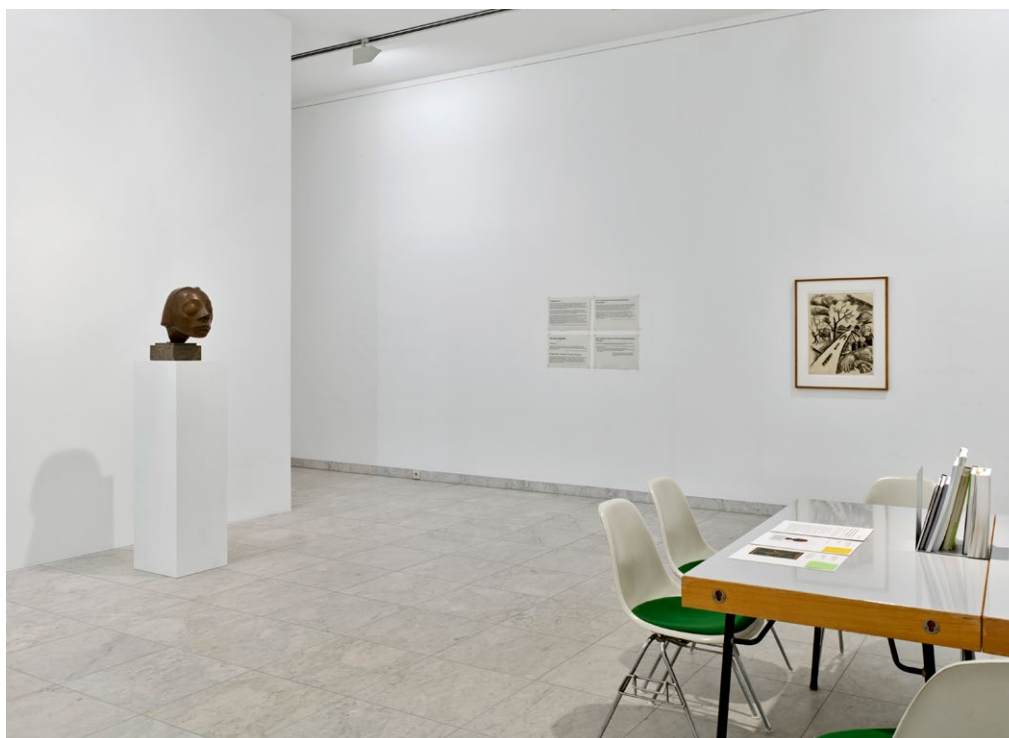
August Macke, Ernte, 1911, Wachskreide auf Transparent-Zeichenpapier, 62,1 x 47,7 cm neben Ernst Barlachs Kopf des Güstrower Ehrenmals, 1927 (1938), Installationsansicht Studienraum Provenienzforschung im Museum Abteiberg, 2026.

Zeichnung von August Macke kehrt nach Mönchengladbach zurück